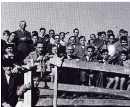
Posible plaza no permanente de 1948