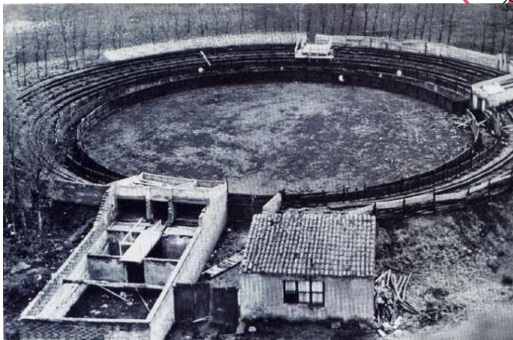
Estado de la plaza de toros a comienzos de los años 50.

El 7 de junio de 1948, el Contratista de obras, Don Benito Sainz de la Maza, natural de Baracaldo y con domicilio en la Villa se compromete a realizar las obras por 18.100 ptas. El resto de tierra para refuerzo de la grada fue realizado a veredas por los vecinos del pueblo.